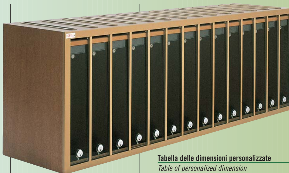
Tabella delle dimensioni personalizzate