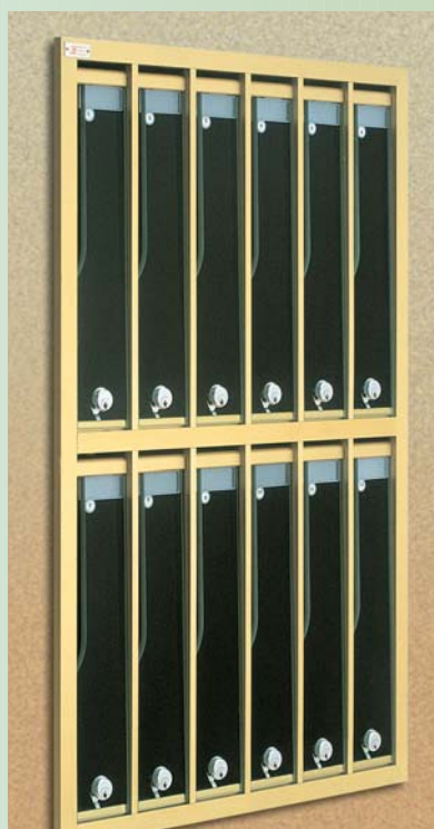
INCASSO WALL INSERTION